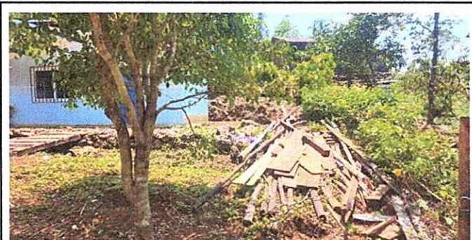
Foto 6: Evidencia de falta de un lugar adecuado para almacenamiento de los restos y/o desperdicios.

Observación: Si es necesario se pueden agregar hojas adicionales y actualizar el número de hojas.