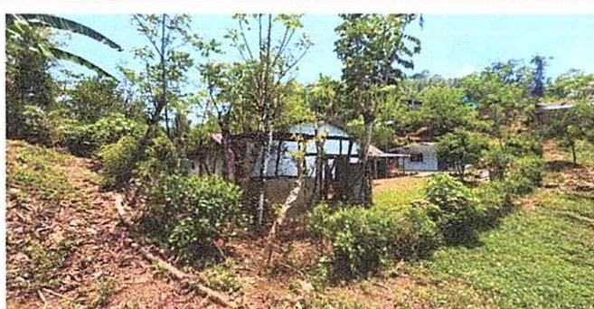
Foto 3: Evidencia de la falta de cercado y perimetrado de la escuela lo que facilita el ingreso de cualquier tipo de personas y/o animales.