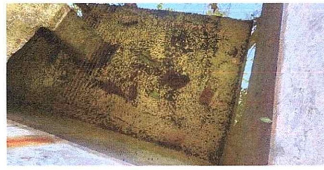
Foto 6: Evidencia de la mala calidad de agua que es utilizada por los niños, esto a falta de un receptorio adecuado.

Observación: Si es necesario se pueden agregar hojas adicionales y actualizar el número de hojas.