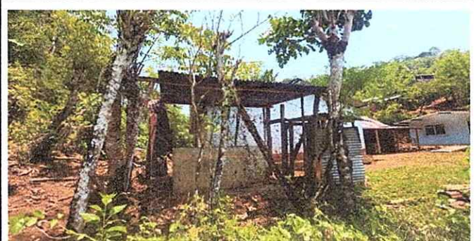
Foto 4: Evidencia de la falta de un receptorio adecuado de agua pluvial.