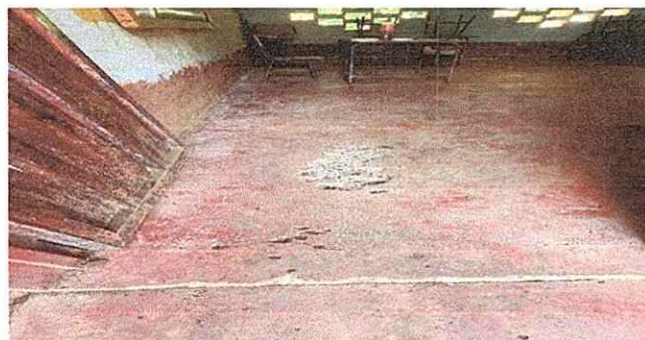
Foto 3: Evidencia de la falta de piso y el mal estado en el que se encuentra actualmente.