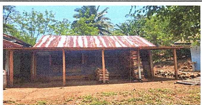
Foto 5: Evidencia de falta de piso lo cual perjudica a la libre locomoción.