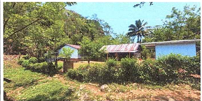
Foto 2: Evidencia de la necesidad de cambio de techo y estructura del mismo.