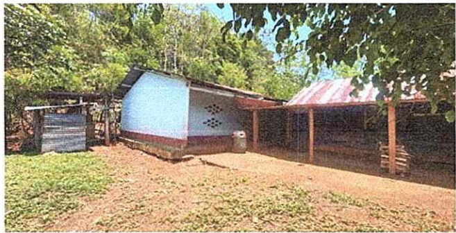
Foto 1: Evidencia de la necesidad de cambio de techo y estructura del mismo.